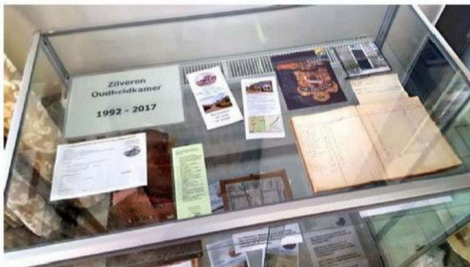
Expositie 'Zilveren Oudheidkamer 1992-2017' in het leescafé in de nieuwe Batavier