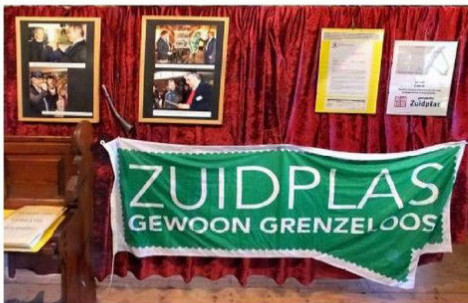
Expositie '25 jaar Oudheidkamer en Nieuwerkerkse iconen' in de Oudheidkamer (opgehangen voorwerpen staan ook op de foto's erbij).